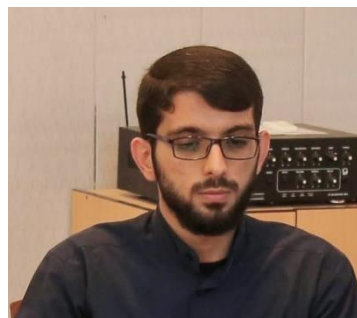
مسئول دفتر مرکزی متخصص گرافیک و خدمات سیستمی ساماندهی و مدیریت پروژه های داخلی

درگزارش قبل با اعضای هیأت مدیره بنیاد خیرین آشنا شدیم. در دومین گزارش به معرفی ساختار درونی، مدیریت اجرایی و معاونت های اجرایی این بنیاد که غالباً مصوب هیأت مدیره است و مختصراً رزومه ایی از معاونین محترم ارائه می گردد.