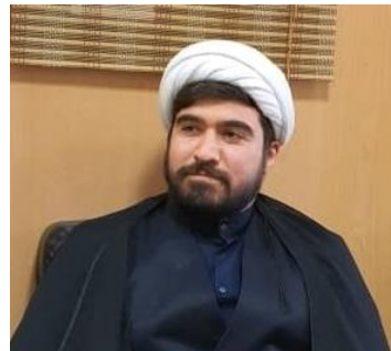
معاون جذب و توسعه کارشناس ارشد اقتصاد اسلامی روابط عمومی اداره کل جامعه نخبگانی