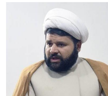
مسئول طرح و برنامه دکترای فقه و حقوق اسلامی استاد سطح عالی حوزه علمیه