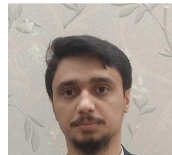
معاون رسانه طراح سایت، مدیر استدیو ملک متخصص سئو و دیجیتال مارکتینگ